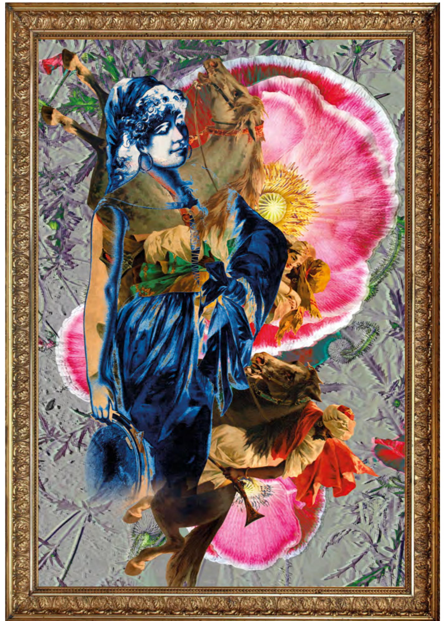
Collage aus der Serie HÖHLE DES LÖWEN Chalet5 2023 Plakatdruck Digital 129 x 90.5 cm