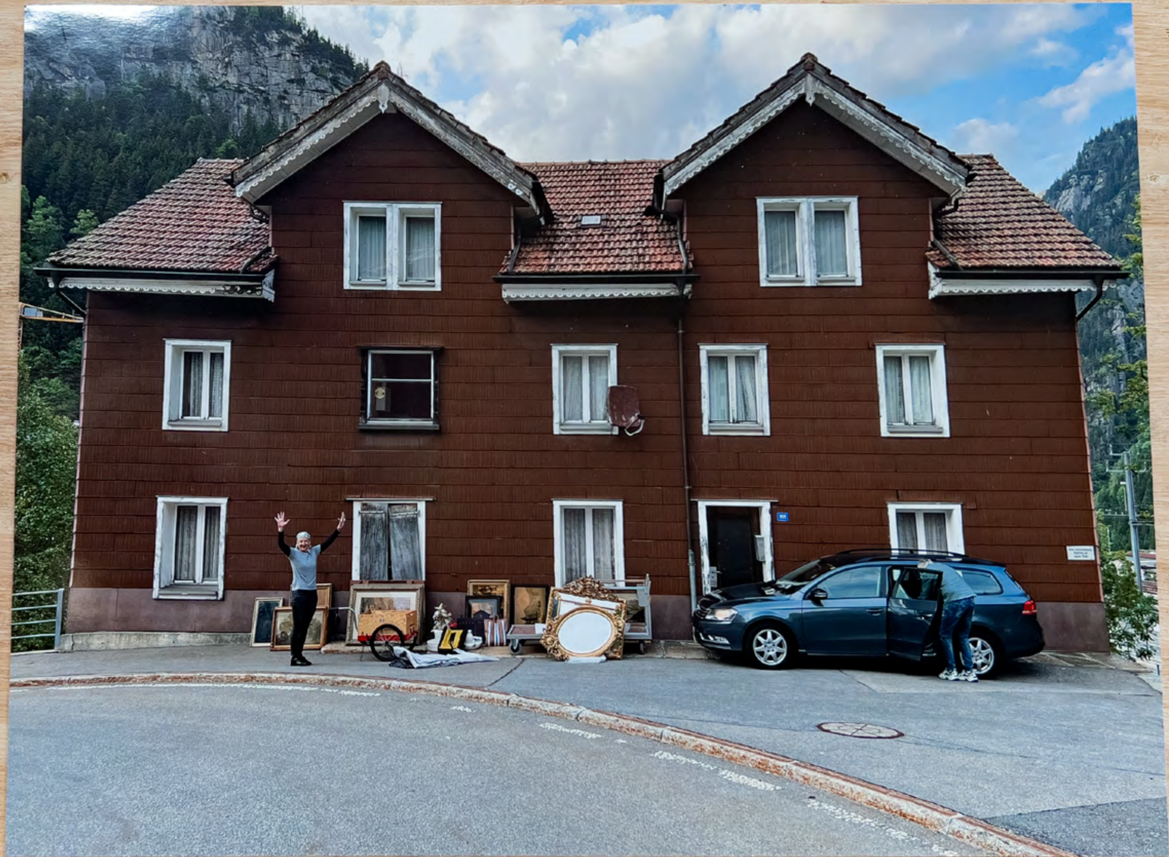
Karin und die Leihgaben, vor dem ehemaligen Hotel Löwen Terminus Göschenen, 6. Juni 2023, 19:38