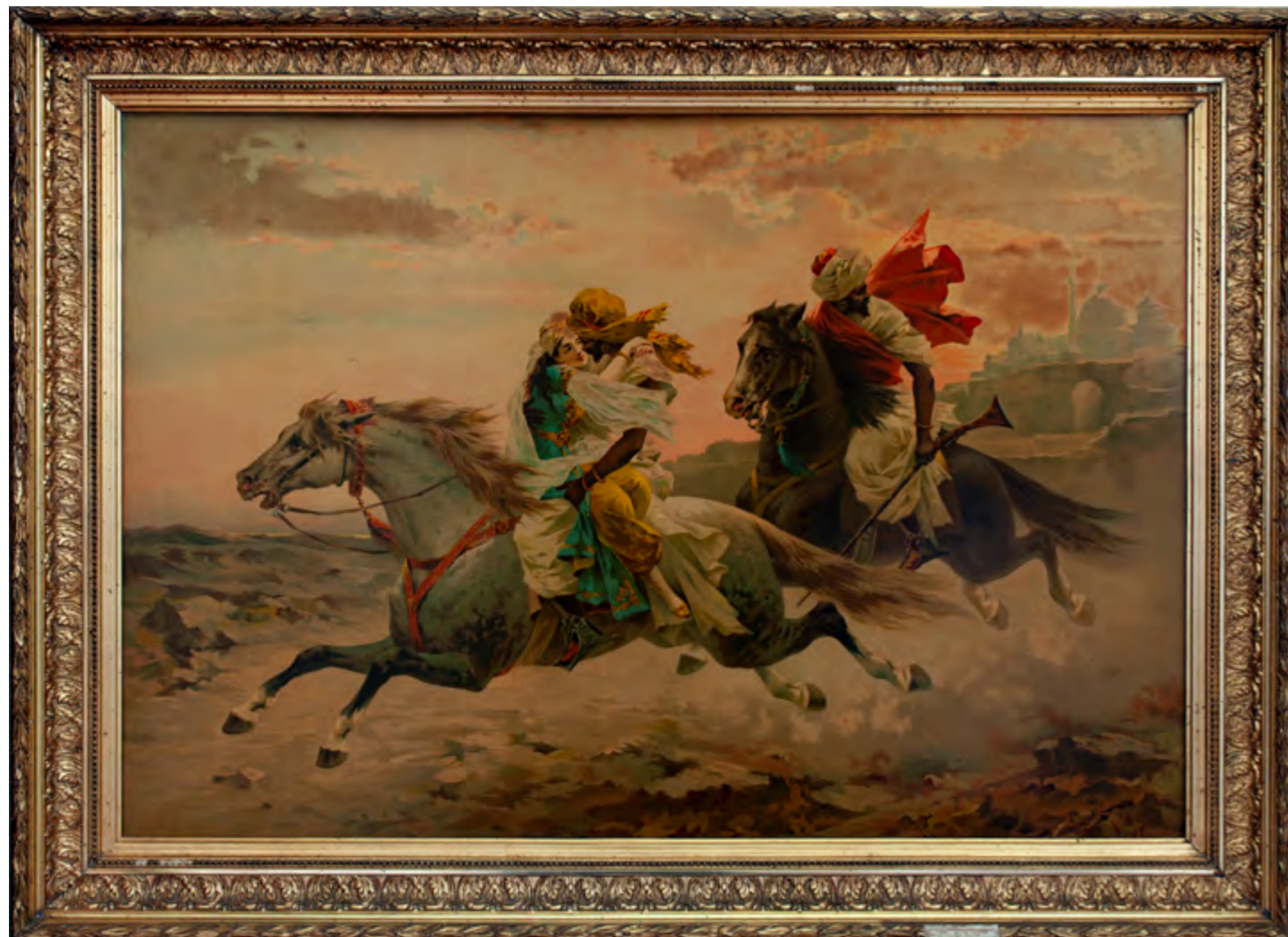
DIE ENTFÜHRUNG AUS DEM SERAIL Luigi Crosio Leihgabe ehemaliges Hotel Löwen - Terminus